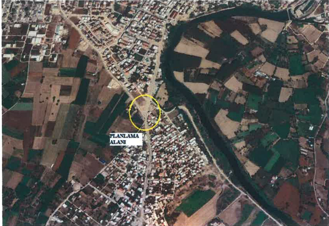
Şekil 1: Planlama alanı (Google earth'den alınmıştır)

Söz konusu alan Mustafakemalpaşa-Devecikonaęı Devlet Yolu üzerinde olup Yalıntaş Caddesi ile Alpaslan Türkeş Caddesinin keşiştięi kavşak noktası ve yakın çevresini kapsamaktadır. Yalıntaş Caddesi 24 m, Alpaslan Türkeş Caddesi 17 m en kesitlidir.