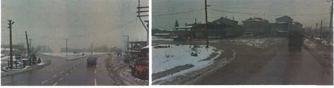
Şekil 4: planlama alanı genel görünüm