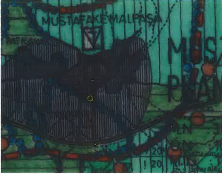
Şekil 5: 1/100000 ölçekli çevre düzeni planı

Plan değişikliğine konu alan 1/100000 ölçekli Bursa 2020 Çevre Düzeni Planında "Mevcut Kentsel Yerleşimler" olarak tanımlanan bölgede kalmaktadır.