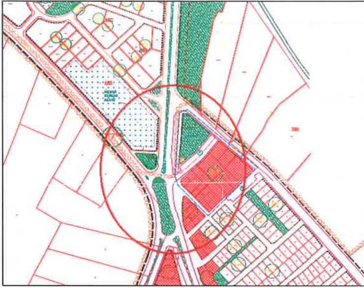
Şekil 7: 1/1000 ölçekli uygulama imar planı

Plan değişikliğine konu alan 1/1000 ölçekli Mustafakemalpaşa Uygulama İmar Planı ve Yalıntaş Uygulama İmar Planı sınırlarında kalmaktadır.