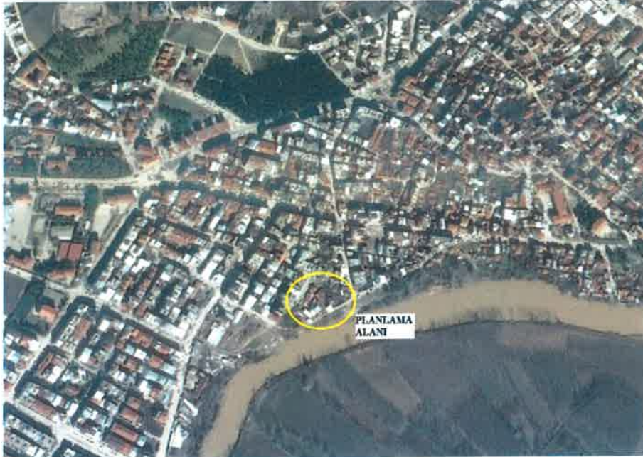
Planlama alanı

Plan değişikliğine konu alan ilçe yerleşik alanının güneyinde Mustafakemalpaşa Deresinin kuzeyinde dere kenarında yer almaktadır. Alan 10 m yol ve yeşil alan olarak planlanmış durumdadır.