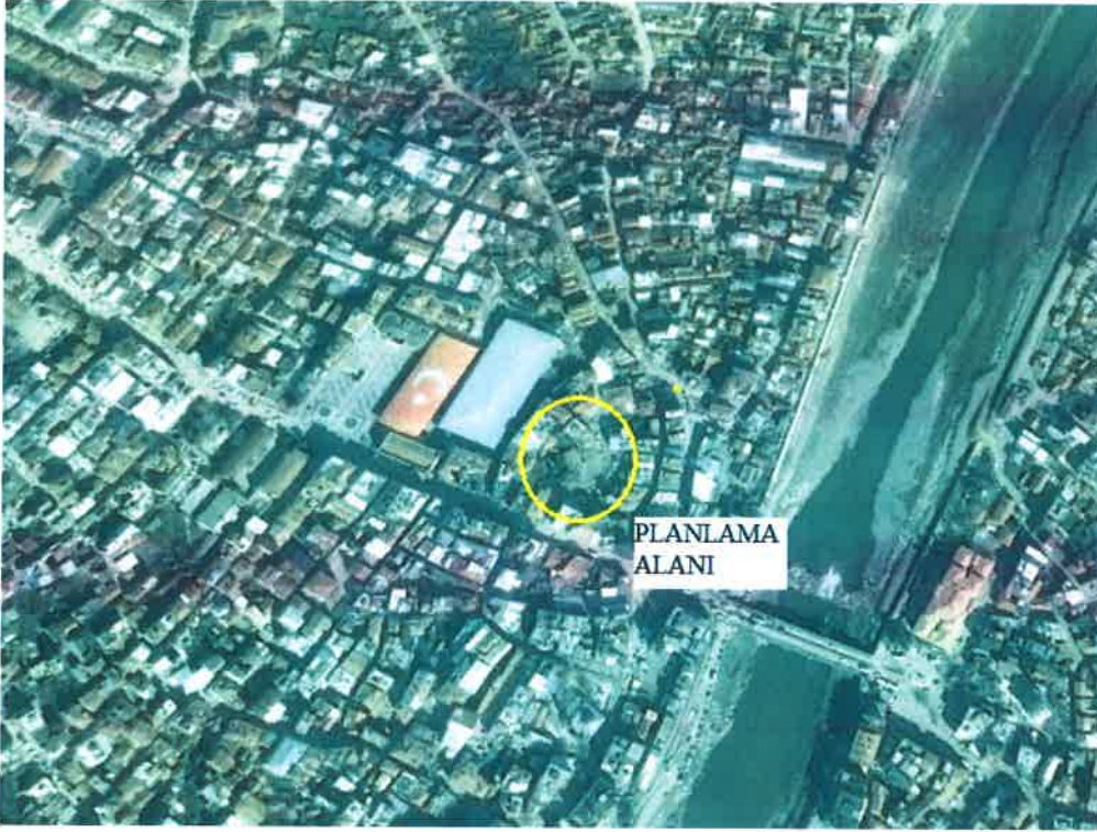
Planlama alanı

Alanın eğimi %5'in altında olup düz bir topografyaya sahiptir. Alan büyük ölçüde boş olup halihazırda otopark olarak kullanılmaktadır.