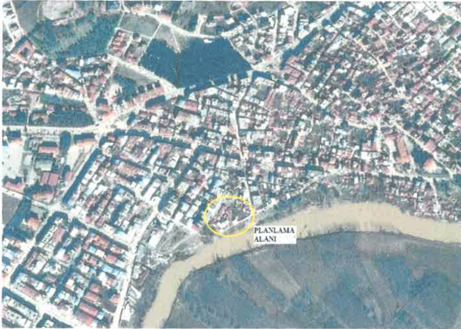
Planlama alanı

Alanın kuzeyinden kentin ana ulaşım akslarından Balıkesir Caddesi geçmekte olup bölgeye ana ulaşım bu yoldan sağlanmaktadır. Balıkesir Caddesinden alana ulaşım 10 m'lik ulaşım akslarıyla sağlanmaktadır.