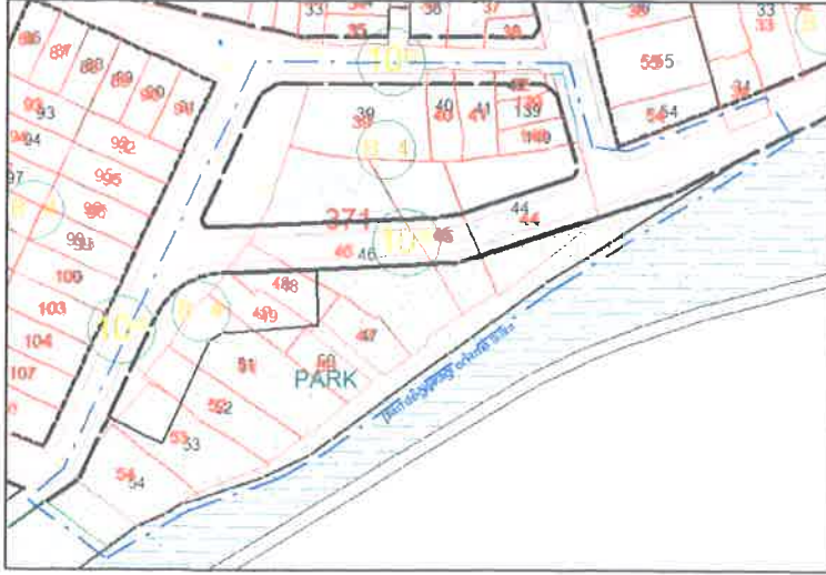
Plan değişikliği örneği

1/1000 ölçekli uygulama imar planı değişikliğinde yürürlükteki 1/1000 ölçekli Mustafakemalpaşa uygulama imar planı hükümleri geçerlidir.