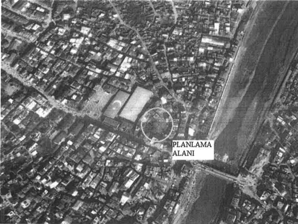
Planlama alanı

Alanın eğimi %5'in altında olup düz bir topografyaya sahiptir. Alan büyük ölçüde boş olup otopark olarak kullanılmaktadır.