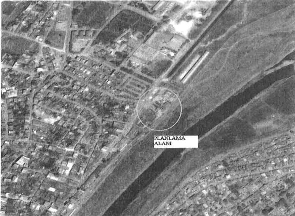
Planlama alanı

Alan ilçe merkezinin kuzeyinde ve Bursa Caddesine 750 m mesafededir.